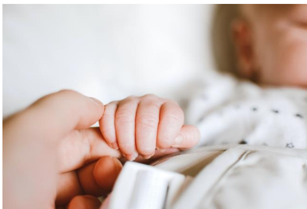
(a kép a pexel.hu oldalon megtalálható)

Fizetni az étkezés igénybevételéért szükséges, a megállapított személyi térítési díj erejéig. A törvényben megfogalmazott feltételekkel rendelkező szülőknek ingyenesen étkezhetsz gyermeke az intézményekben. Az étkezési térítési díj befizetése minden esetben a tárgyhónapot megelőző hónapban történik, amelynek teljesítése átutalással történik.