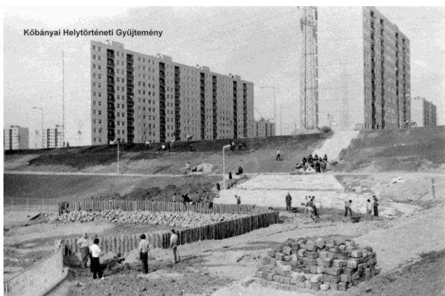
(Az épülő lakótelep)

Mivel a városrész az 1970-es évek óta létezik jelenlegi formájában, ezért nincs nagy története. 1970 előtt szőlőföldek és bányák voltak ezen a területen, majd 1974 - 76 között épült a több tízezer ember számára otthont adó lakótelep.