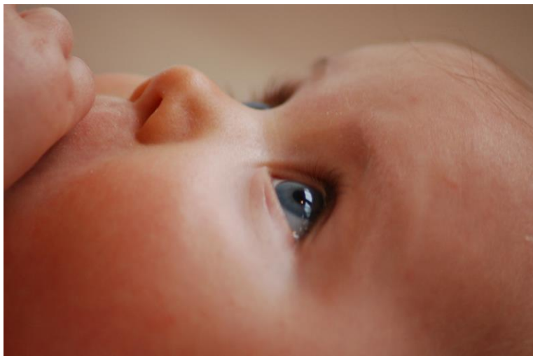
(a kép letölthető a pixabay.hu oldalról)

A gyermek bölcsődei felvételekor az ellátásban részesülő gyermek szülője (törvényes képviselője) valamint a Kőbányai Egyesített Bölcsődék tagintézménye, mint a napközbeni ellátását biztosító intézmény, írásos megállapodást köt (1. számú melléklet).